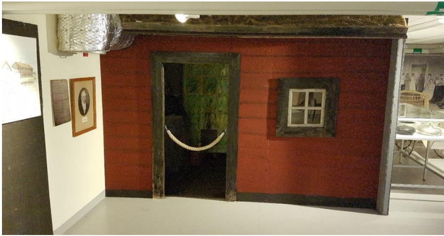
Modell av Västerås första sjukhus 1776