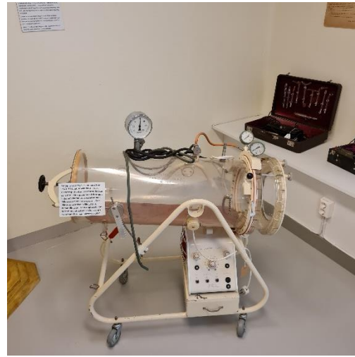
Tidig apparat för hyperbar syrgasbehandling.

Nätverksträffen för medicinhistoriska museer i Sverige hölls detta år digitalt från Göteborg. Som alltid mycket värdefullt!